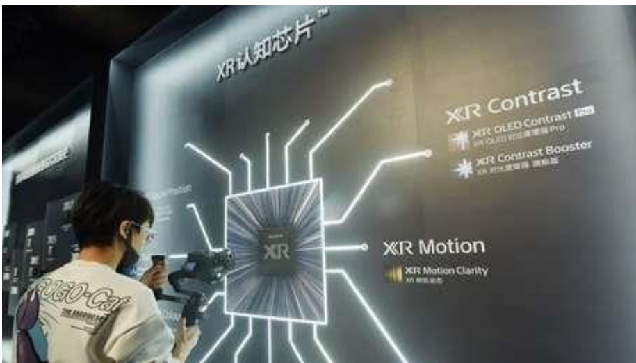
Corona-Ausschuss: "Das kostet tagtäglich weltweit Menschenleben" – Teil 1

Dabei gebe es drei Szenarien für verschiedene Verfügbarkeiten der Impfungen, von sehr knapp bis ausreichend für die Mehrheit der Bevölkerung.