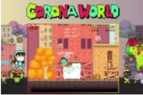
Coronaworld vom Staatsrundfunk

2. „Kinder werden kaum unter der Epidemie leiden“: Falsch. Kinder werden sich leicht anstecken, selbst bei Ausgangsbeschränkungen, z.B. bei den Nachbarskindern. Wenn sie dann ihre Eltern anstecken, und einer davon qualvoll zu Hause stirbt und sie das Gefühl haben, Schuld daran zu sein, weil sie z.B. vergessen haben, sich nach dem Spielen die Hände zu waschen, ist es das Schrecklichste, was ein Kind je erleben kann.