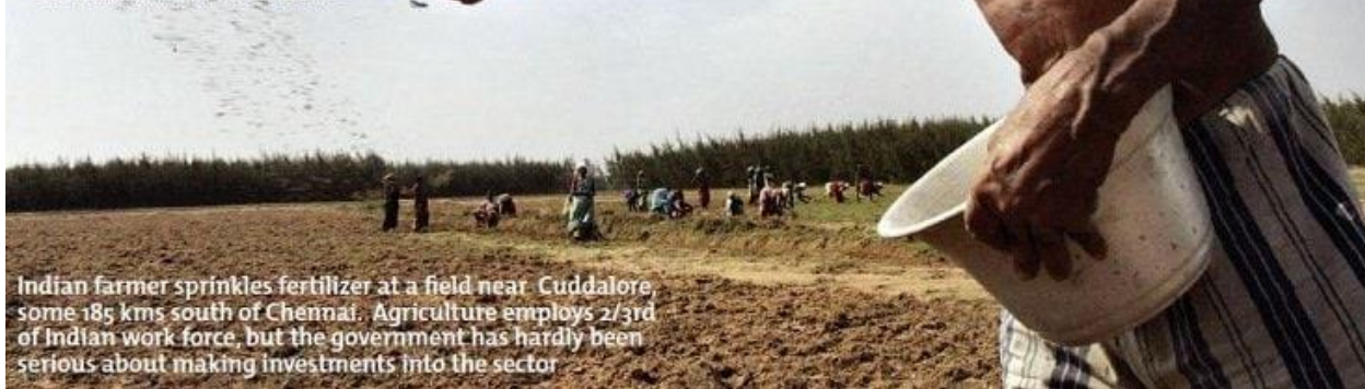
Indian farmer sprinkles fertilizer at a field near Cuddalore, some 185 kms south of Chennai. Agriculture employs 2/3rd of Indian work force, but the government has hardly been serious about making investments into the sector