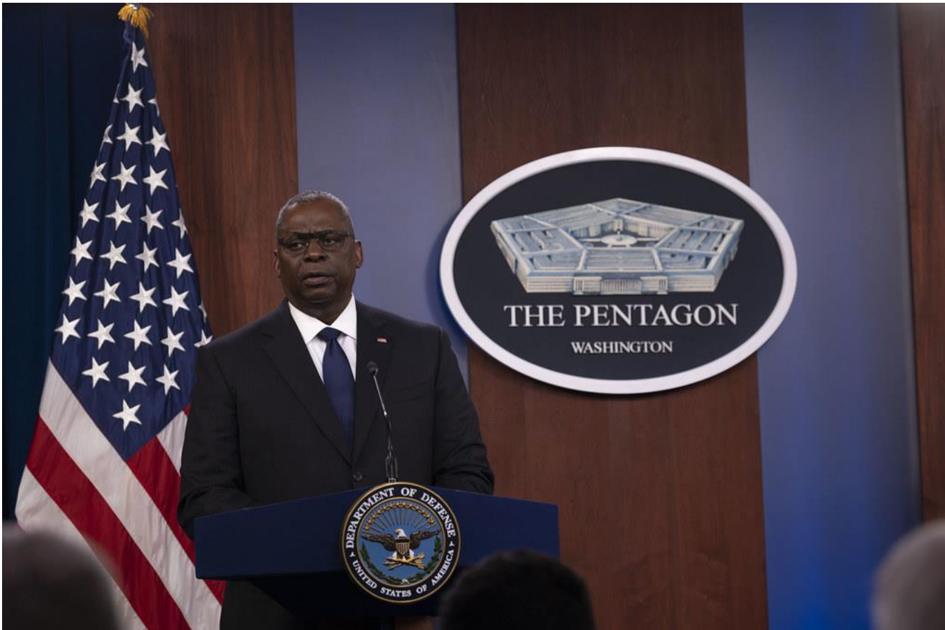
Verteidigungsminister Lloyd J. Austin