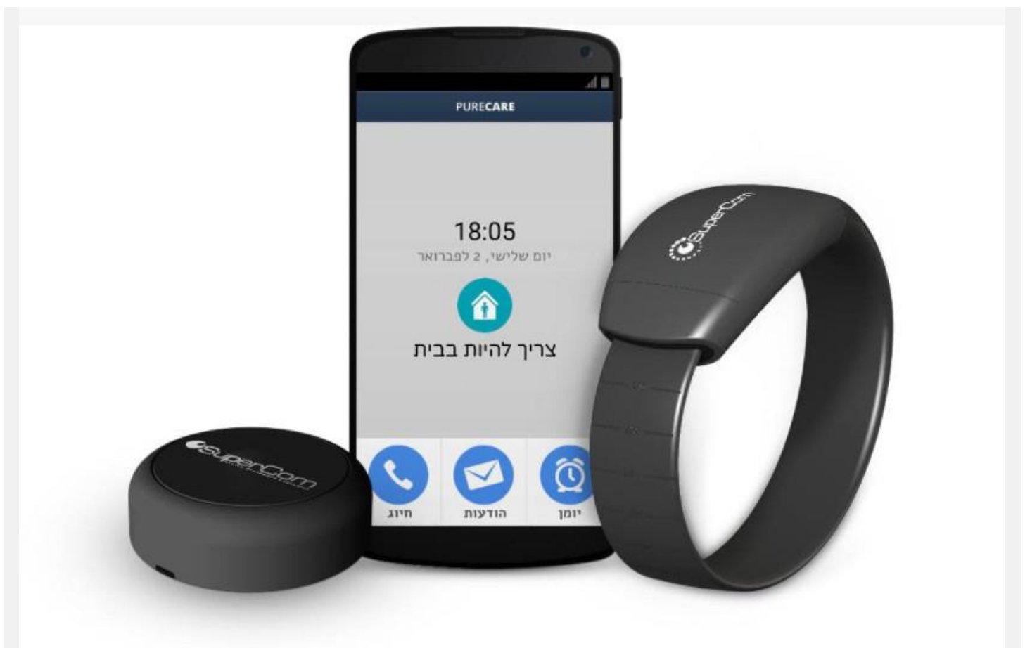
Freedom Bracelet