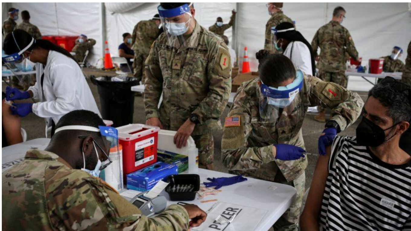
Und einfach so endete das Maskenmandat