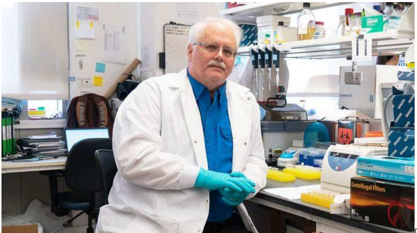
Der amerikanische Forscher Ralph Baric , der seit 2000 die meisten Experimente mit modifizierten Coronaviren im Labor

"Unter Verwendung eines Panels zusammenhängender cDNAs, die das gesamte Genom abdecken, haben wir eine cDNA in voller Länge des Urbani-SARS-CoV-Stammes assembliert und molekular klonierte SARS-Viren (SARS-CoV-infektioser Klon) gerettet, die die erwarteten Markermutationen enthielten, die in die Komponentenkclone eingefügt wurden.